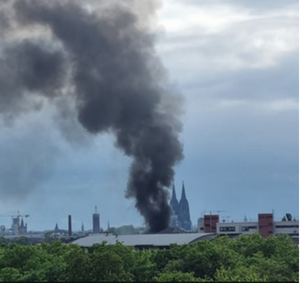
حريق مصحوب بتصاعد كثيف للدخان

يمكن أن يكون هذا هو الحال، على سبيل المثال، في حالة تسرب مادة خطيرة، وفي حالة نشوب حريق أو بعد وقوع حادث. بالإضافة إلى ذلك، يمكن أيضًا إصدار تحذيرات من حدوث فيضان مفاجئ لنهر الراين أو روافده الصغيرة في كولونيا. وتُعد إشارة الإنذار بمثابة جرس إنذار للسكان.