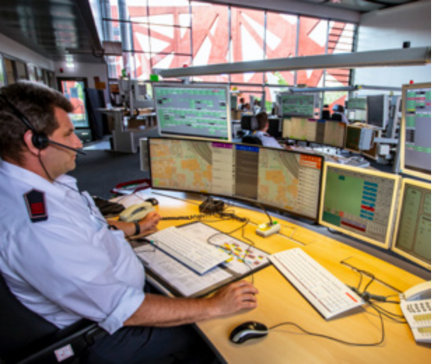
مركز إدارة مطافئ كولونيا

تشرح هذه المطوية معنى إشارات صفارات الإنذار وتقدم توصيات لطرق التصرف. وهي تحتوي أيضًا على مراجع أخرى لأرقام الهواتف المهمة أو محطات الراديو المحلية أو الصفحة الرئيسية للمدينة، والتي يمكنك استخدامها للحصول على مزيد من المعلومات.